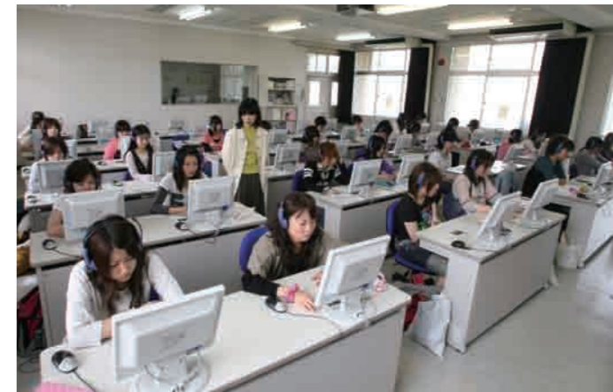
LL演習 I 演習風景