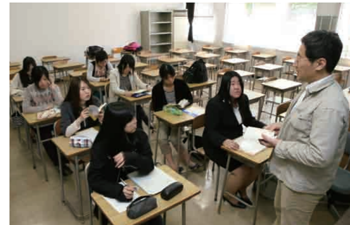
日本文法論 授業風景