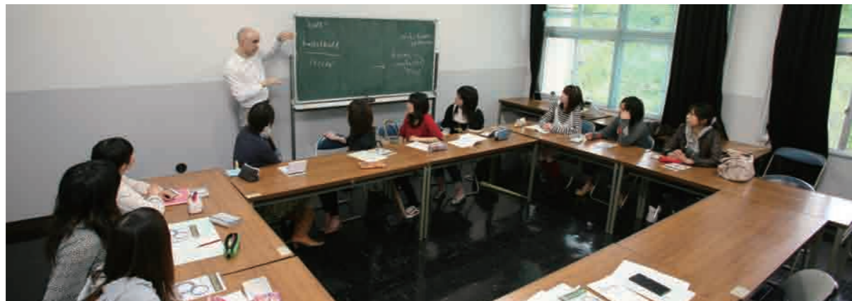
オーラルコミュニケーションIII 授業風景