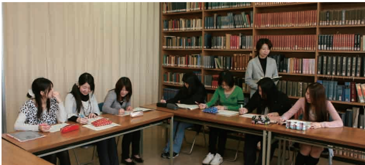
日本文学演習 II 授業風景