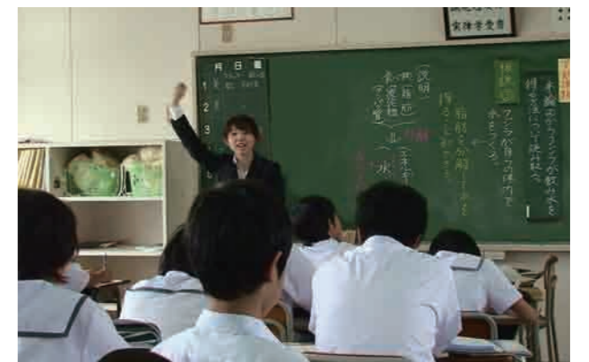
キャリアデザイン 講義風景 (上) 教育実習模擬授業風景 (中) 教育実習 (中学国語) 風景 (下)