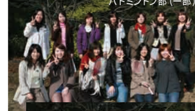
バドミントン部(一部)