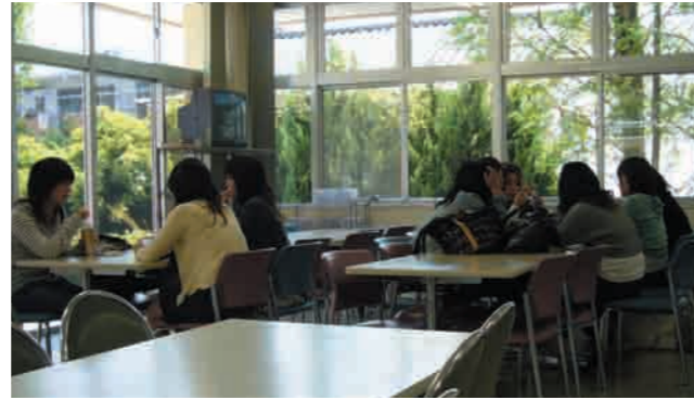
2 学生会館 (学生食堂) 学生同士の語らいの場であり、学生と教職員のコミュニケーションホールにもなっているのが学生会館です。その中にある学生食堂は、安くて美味しいと評判です。