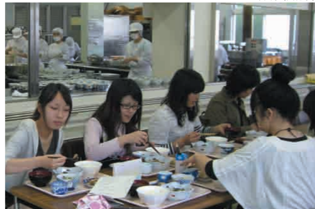
学内給食管理実習