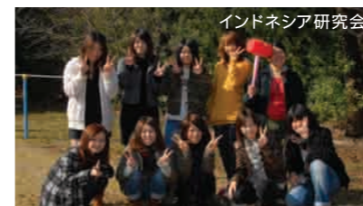
インドネシア研究会