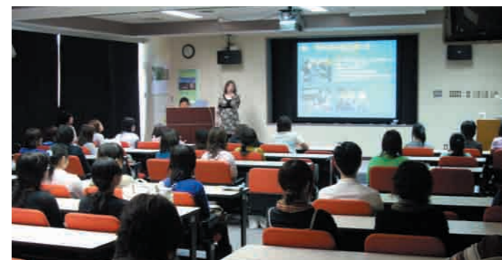
11 視聴覚室 附属図書館2階にある視聴覚室は、通常授業のほか、様々な講演会や卒業研究発表会等に利用されています。