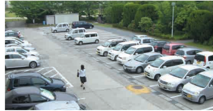
5 第3駐車場 通学で利用する自動車・単車・自転車のための駐車・駐輪場です。学内には第1駐車場から第4駐車場までスペースが設けられています。