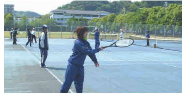
7 テニスコート ナイター設備のあるコートが4面あります。全天候型コートですので、雨上がりでもすぐに水が乾きます。