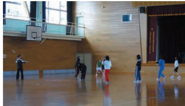
4 体育館 バレーボール・バスケットボール・バドミントン・卓球等、授業以外のサークル活動にも使用しています。