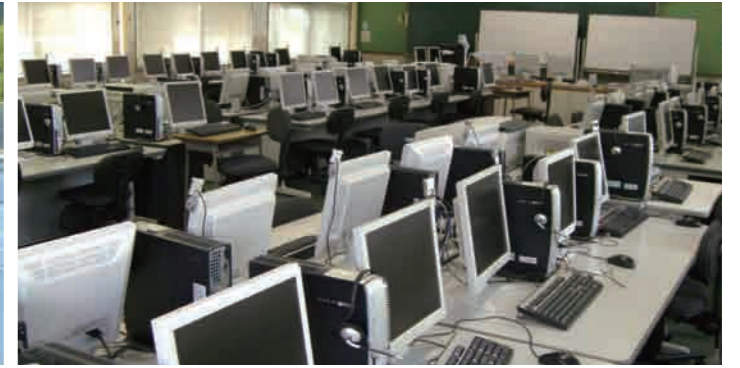
8 第1パソコン室 本学には、第1パソコン室と第2パソコン室、及びパソコン自習室があります。