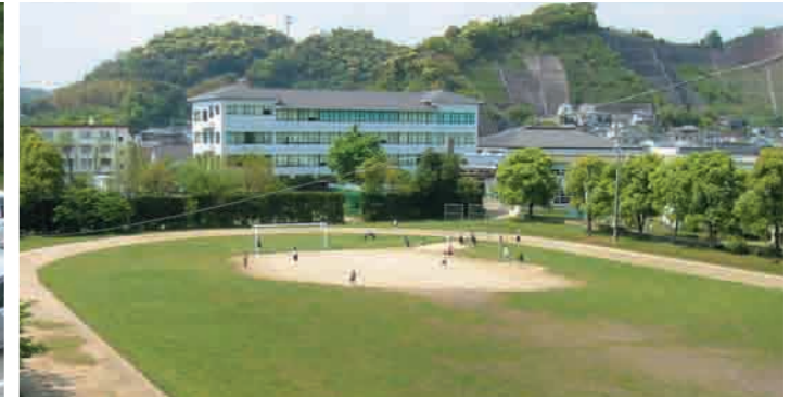
6 グラウンド 一周330メートルのグラウンドです。ナイター設備があるので、夜間の利用も盛んに行われています。