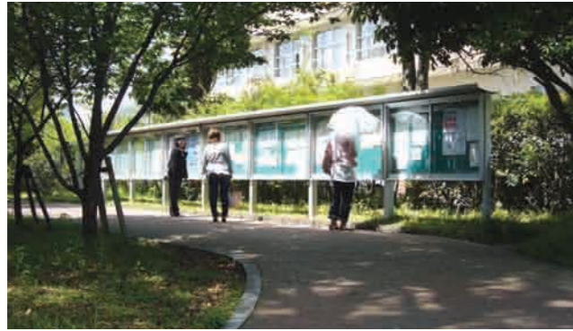
1 掲示版 時間割、試験、休講、補講、及び教室変更等、学生への連絡や通知を掲示します(休講情報はホームページにも掲載されます)。