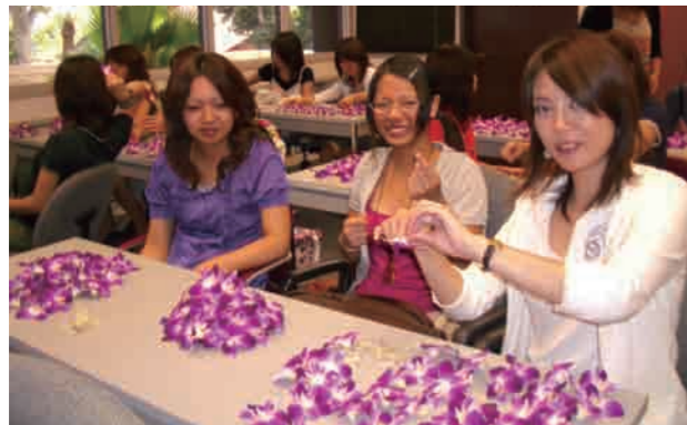
社会活動 ボランティア (上) 異文化体験 ハワイ ハワイ大学コミュニティカレッジにて (左) 異文化体験 インドネシア パジャジャラン大学にて (下) 異文化コミュニケーション 中国 南京農業大学にて (下)