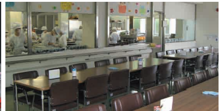
10 集団給食実習室 生活科学科食物栄養専攻では2年生になると、給食管理実習として、学内で年8回の給食サービスを実施しています。鹿児島県の季節の食材を使ったメニューは、栄養バランスだけでなく、盛り付けや調理法にも工夫を取り入れています。