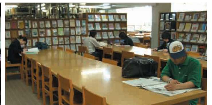
12 附属図書館 約12万冊の蔵書の他、雑誌約1500タイトル、ビデオやLD、DVDなどの視聴覚資料も揃っています。図書資料の利用者端末等での検索や、他大学の資料の検索・閲覧・複写や借受けもできます。