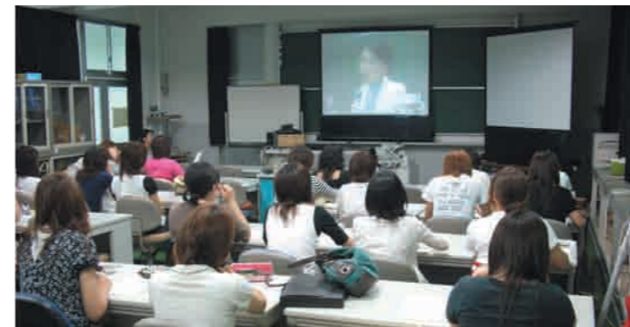
9 ワークステーション室 通常の授業のほかに、テレビ会議等にも使用されています。