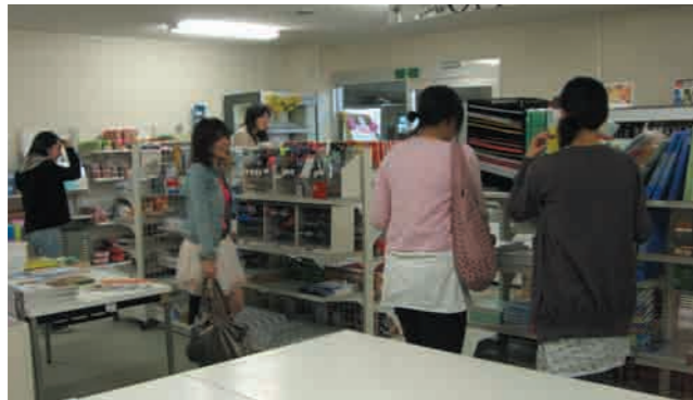
3 学生会館 (生協売店) 学生と教職員が出資・運営する自主的相互組織として、生活協同組合があります。書籍・文具からCD・パソコンにいたるまで安価で豊富な品揃えでキャンパスライフをバックアップしています。