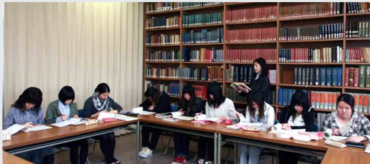
日本文学演習 II 授業風景