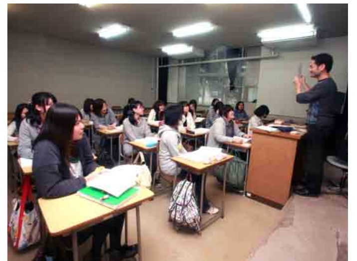
中国語 I 授業風景