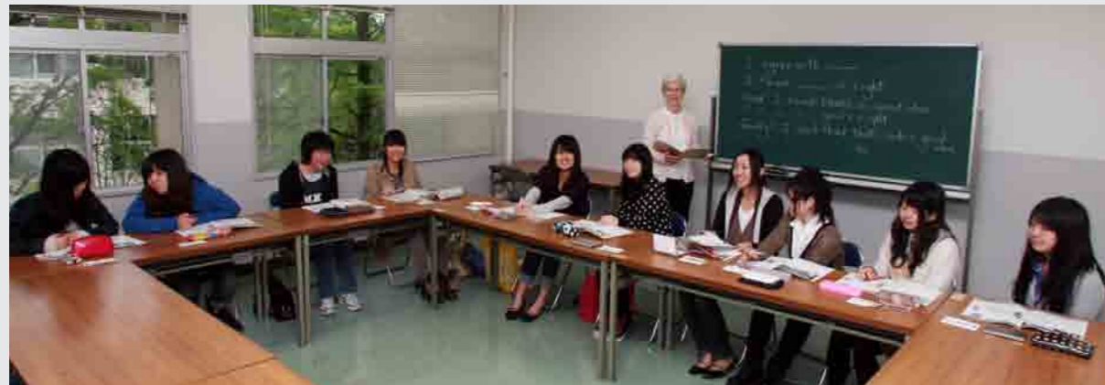
オーラルコミュニケーションIII 授業風景