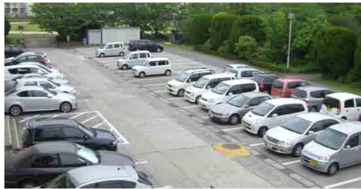
5 第3駐車場 通学で利用する自動車・単車・自転車のための駐車・駐輪場です。学内には第1駐車場から第4駐車場までスペースが設けられています。