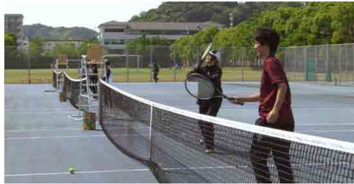
7 テニスコート ナイター設備のあるコートが4面あります。全天候型コートですので、雨上がりでもすぐに水が乾きます。