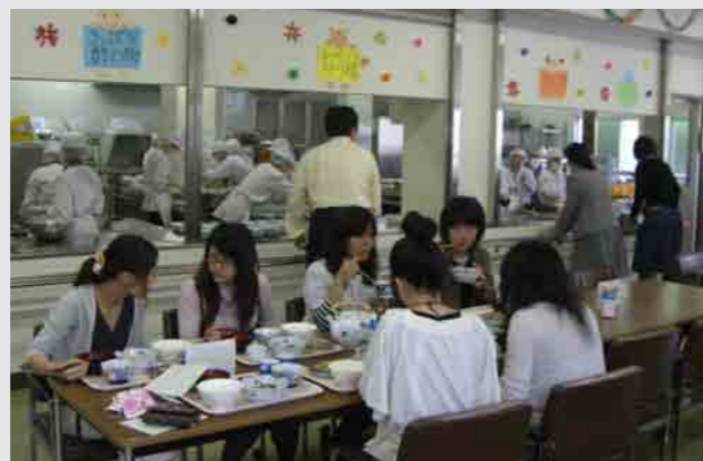
学内給食管理実習