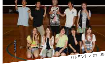
バドミントン(第二部)