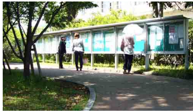
1 掲示版 時間割、試験、休講、補講、及び教室変更等、学生への連絡や通知を掲示します(休講情報はホームページにも掲載されます)。