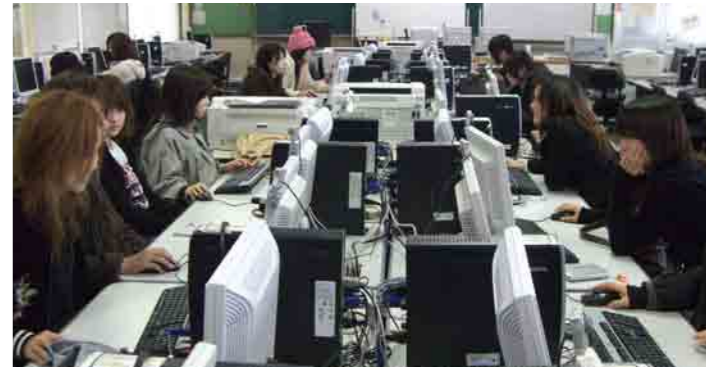
8 第1パソコン室 本学には、第1パソコン室と第2パソコン室、及びパソコン自習室があります。