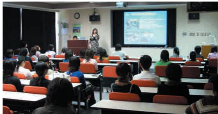
11 視聴覚室 附属図書館2階にある視聴覚室は、通常授業のほか、様々な講演会や卒業研究発表会等に利用されています。