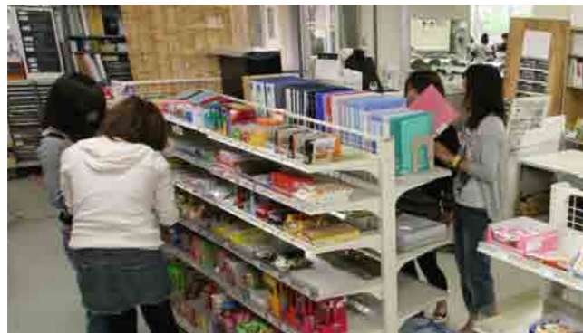
3 学生会館 (生協売店) 学生と教職員が出資・運営する自主的相互組織として、生活協同組合があります。書籍・文具からCD・パソコンにいたるまで安価で豊富な品揃えでキャンパスライフをバックアップしています。