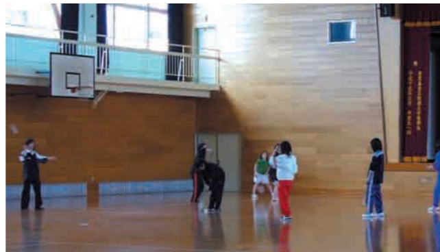
4 体育館 バレーボール・バスケットボール・パドミントン・卓球等、授業以外のサークル活動にも使用しています。