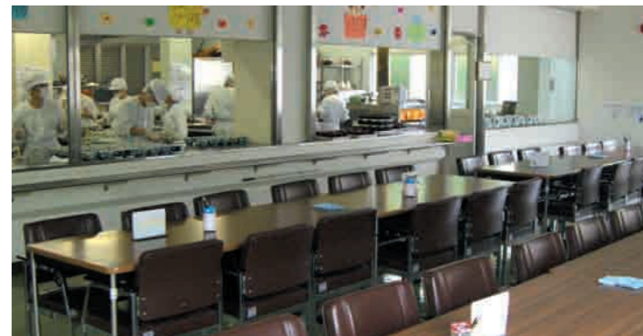
10 集団給食実習室 生活科学科食物栄養専攻では2年生になると、給食管理実習として、学内で年8回の給食サービスを実施しています。鹿児島県の季節の食材を使ったメニューは、栄養バランスだけでなく、盛り付けや調理法にも工夫を取り入れています。