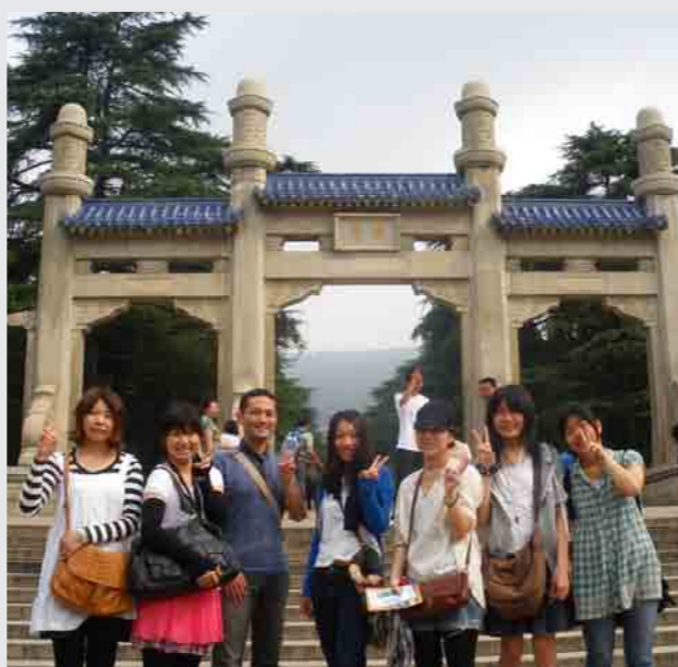
社会活動 錦江湾遠泳（上2点） 異文化体験 ハワイ・ハワイ大学コミュニティカレッジにて（中） 異文化体験 インドネシア・パジャジャラン大学にて（下・左） 異文化コミュニケーション 中国・南京農業大学にて（下・右）