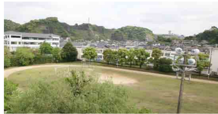
6 グラウンド 一周330メートルのグラウンドです。ナイター設備があるので、夜間の利用も盛んに行われています。