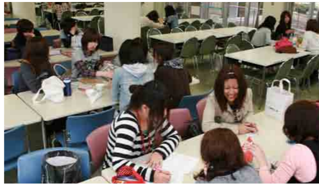
2 学生会館 (学生食堂) 学生同士の語らいの場であり、学生と教職員のコミュニケーションホールにもなっているのが学生会館です。その中にある学生食堂は、安くて美味しいと評判です。