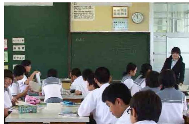
キャリアデザイン 講義風景（上） 教育実習模擬授業風景（中） 教育実習風景（下）