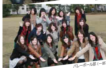
バレーボール部(一部)