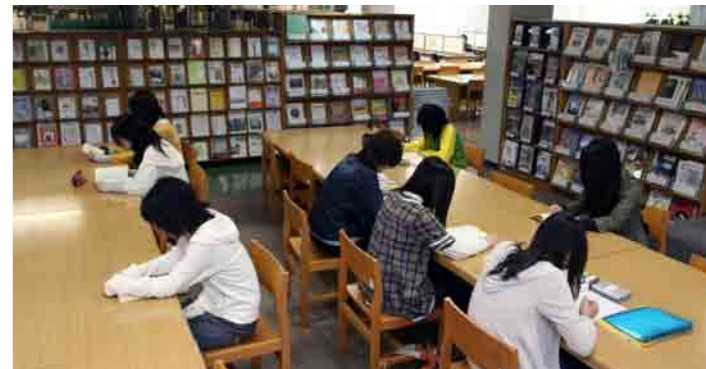
12 附属図書館 約12万冊の蔵書の他、雑誌約1500タイトル、ビデオやLD、DVDなどの視聴覚資料も揃っています。図書資料の利用者端末等での検索や、他大学の資料の検索・閲覧・複写や借受けもできます。