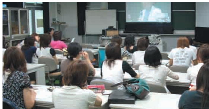
9 ワークステーション室 通常の授業のほかに、テレビ会議等にも使用されています。